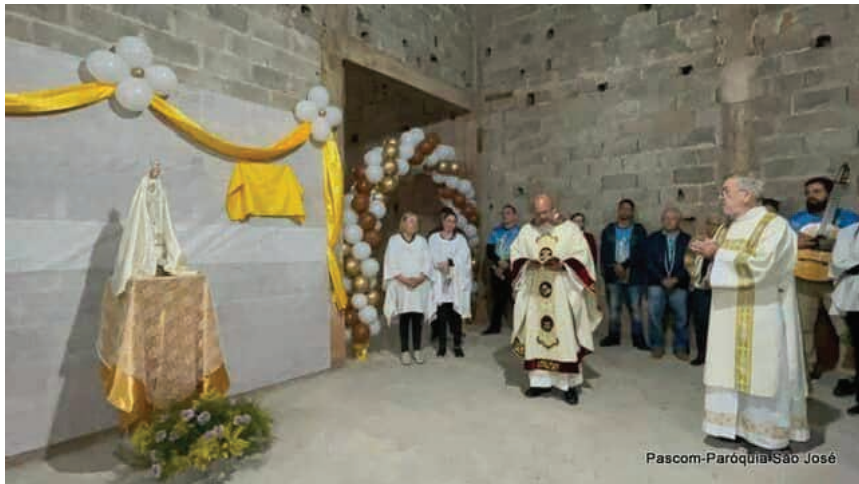
Pascom-Paróquia São José

Local tem placa que celebra início do pontificado do Papa Leão XIV