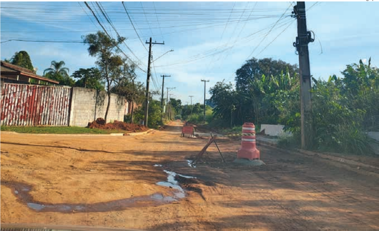
Avenida principal do bairro, que nesta semana recebeu melhorias da empresa contratada