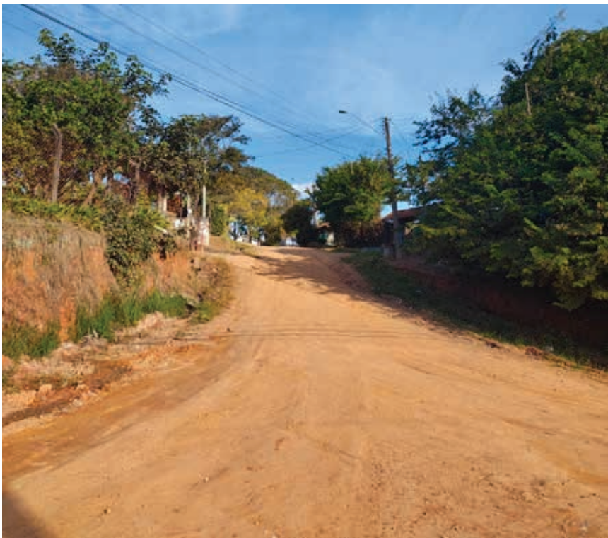
Esta é a Rua das Goiabeiras, que não foi contemplada e, até o momento, não recebeu asfalto e infraestrutura