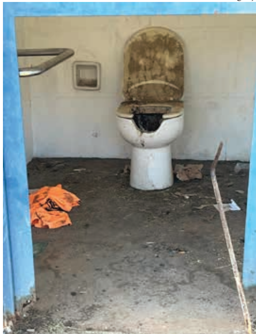
Banheiros dentro do Ciles estão sujos, com portas e assentos sanitários quebrados