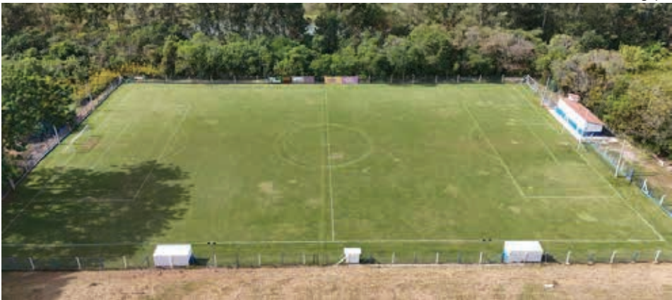
Estádio Municipal Ademir Aranzana, no Bairro da Penha recebe duas partidas neste domingo

Na tarde deste domingo, 15, a bola vai rolar pela Série B do Campeonato Amador de Bragança Paulista com a disputa das quartas de final. Serão quatro partidas decisivas, realizadas em rodada dupla no Estádio Raul Monteiro, nos Altos de Bragança, e no Estádio Municipal Ademir Aranzana, no Bairro da Penha. Os jogos seguem os horários tradicionais: a primeira partida acontece às 13h45 e a segunda às 15h45, ambas com entrada gratuita ao público.