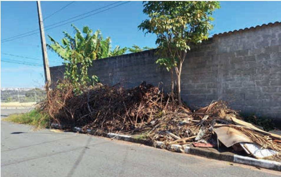
Moradores dizem que as podas de árvores e outros entulhos estão nesta calçada há mais de meses

A equipe de reportagem esteve no local e constatou a situação crítica do espaço público. Os banheiros estão sujos, com portas e assentos sanitários quebrados; a quadra apresenta alambrado danificado e os brinquedos da área de lazer estão enferrujados – consequência da exposição às