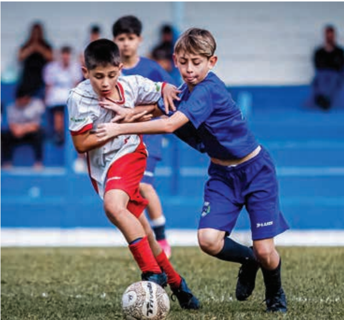
Monte Alegre do Sul aplicou uma goleada por 8 a 0 sobre a Associação Atlética Serrana, na categoria Sub-12

A cidade de Monte Alegre do Sul recebeu, no último domingo, 22, a 9ª rodada da 12ª Copa Monte Alegreense de Futebol de Base, com partidas disputadas nas categorias Sub-12, Sub-14 e Sub-16. Os jogos aconteceram no Estádio Municipal Liduíno Truzzi e, embora nenhuma equipe de Bragança Paulista tenha atuado nesta rodada, a bola rolou para outras agremiações da região. Na abertura do dia, pela categoria Sub-12, a equipe da Associação Atlética Serrana sofreu uma goleada por 8 a 0 diante do time da casa, o Monte Alegre do Sul. A sequência de vitórias do time anfitrião continuou na partida seguinte, pelo Sub-14, quando aplicou