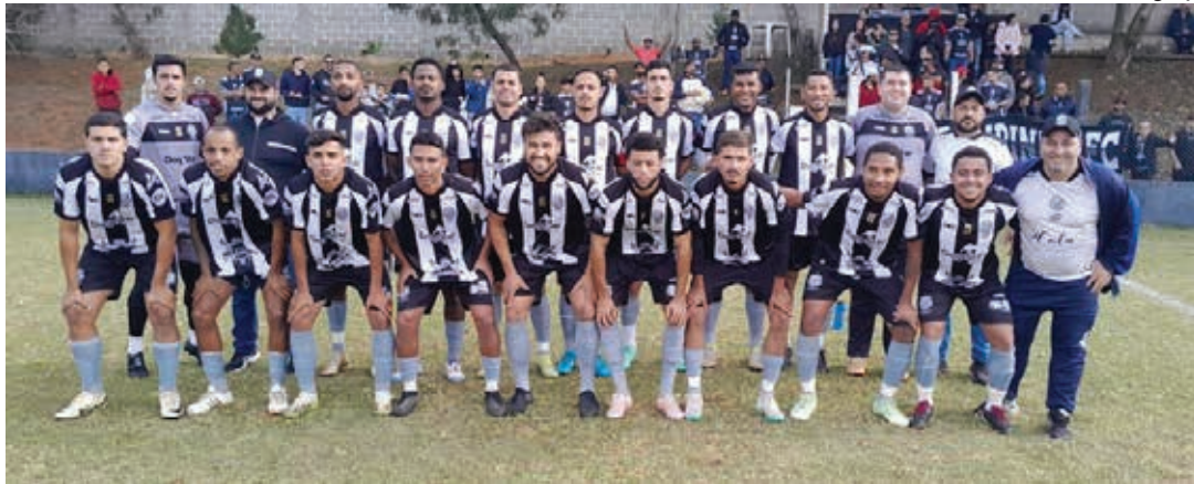
Equipe do Campinho, atual campeã, defende o título conquistado no ano passado

O Ferroviários A.C. é o maior campeão do Campeonato Amador de Bragança, com 19 títulos e, neste ano, busca sua 20ª conquista.