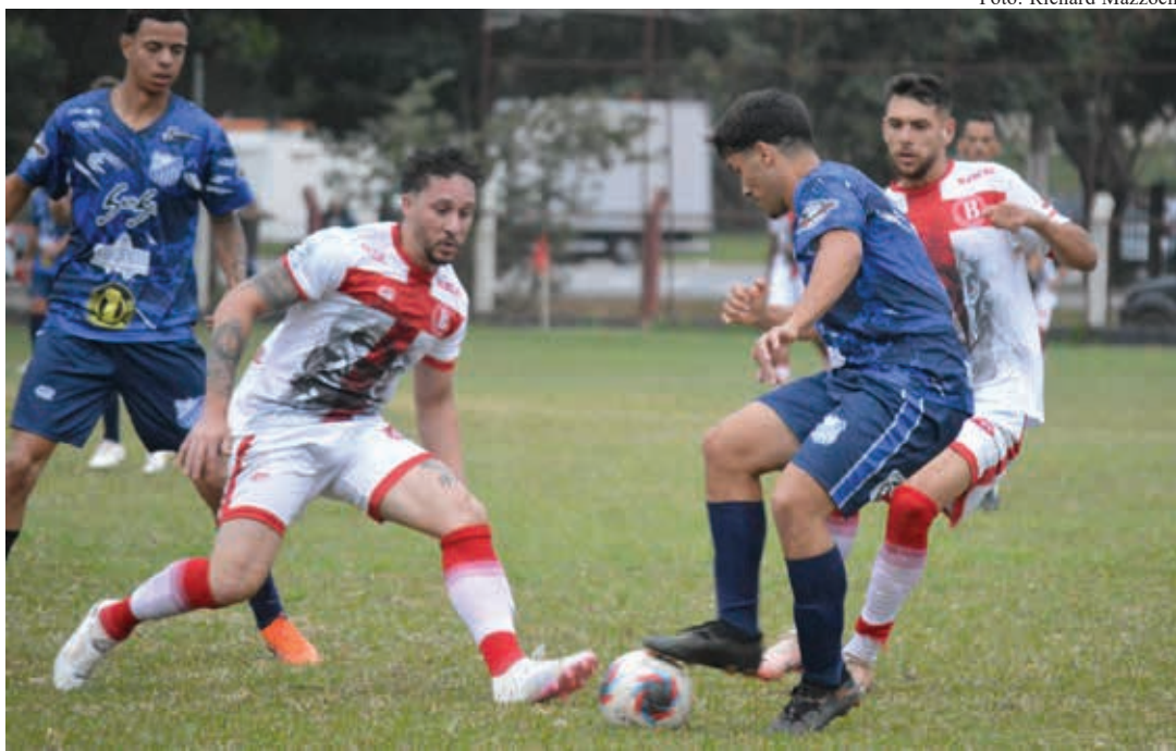
Lance do empate entre Bandeirantes e Pinhalzinho, que agora decidirão a vaga nos pênaltis

A equipe que vencer nas penalidades garantirá não só a vaga na grande final contra o Menin, como também o