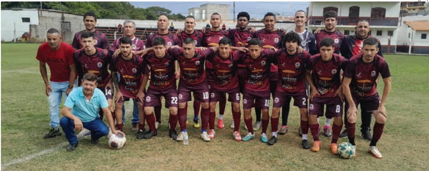
Equipe do Menin aguarda de camarote o seu adversário na final da Série B do Amadorzão 2025