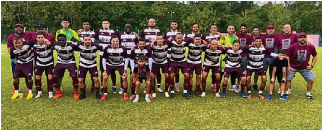
Time dos Ferroviários busca seu 20º título no principal Campeonato Amador de Bragança

Na tarde deste sábado, 28, no Estádio Municipal Ademir Aran-zana, no Bairro da Penha, acontece um encontro inédito na final do Amadorzão 2025 entre o time mais vitorioso do Campeonato Amador de Bragança, o Ferroviários, e o atual campeão, Campinho. A partida terá início às 15h, com 15 minutos de tolerância.