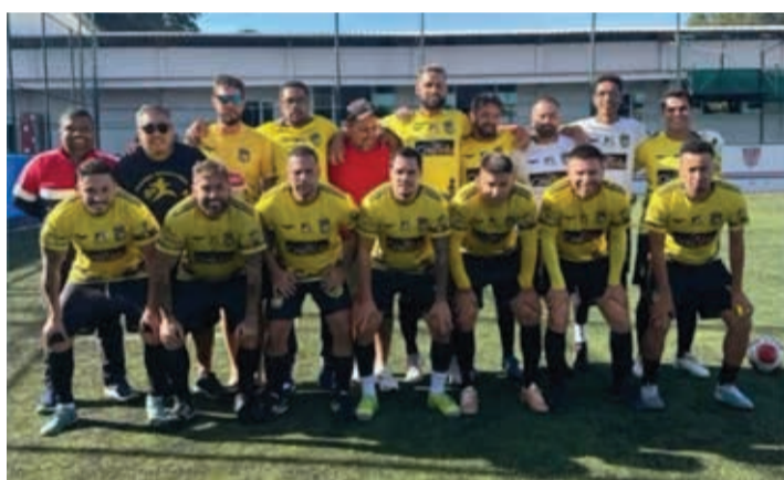
Galera da Breja ficou com o segundo lugar na Série Ouro