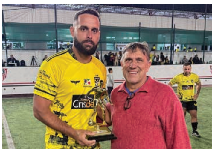
O time Galera da Breja recebeu os troféus de artilheiro e de defesa menos vazada da Série Ouro