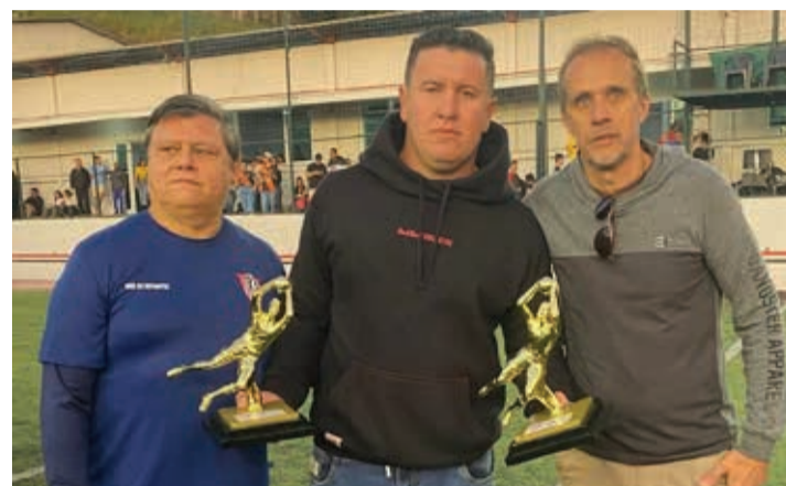
O time do Unidos terminou como campeão com a defesa menos vazada da competição