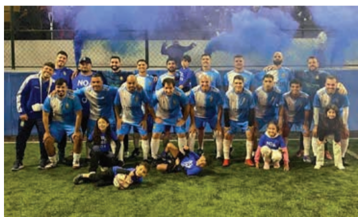
Equipe do Novatos foi a campeã da categoria Série Ouro