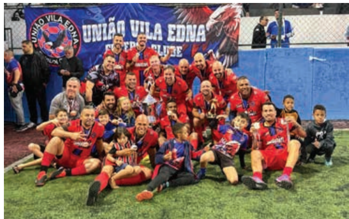
Time do União Vila Edna, campeão da categoria Série Prata