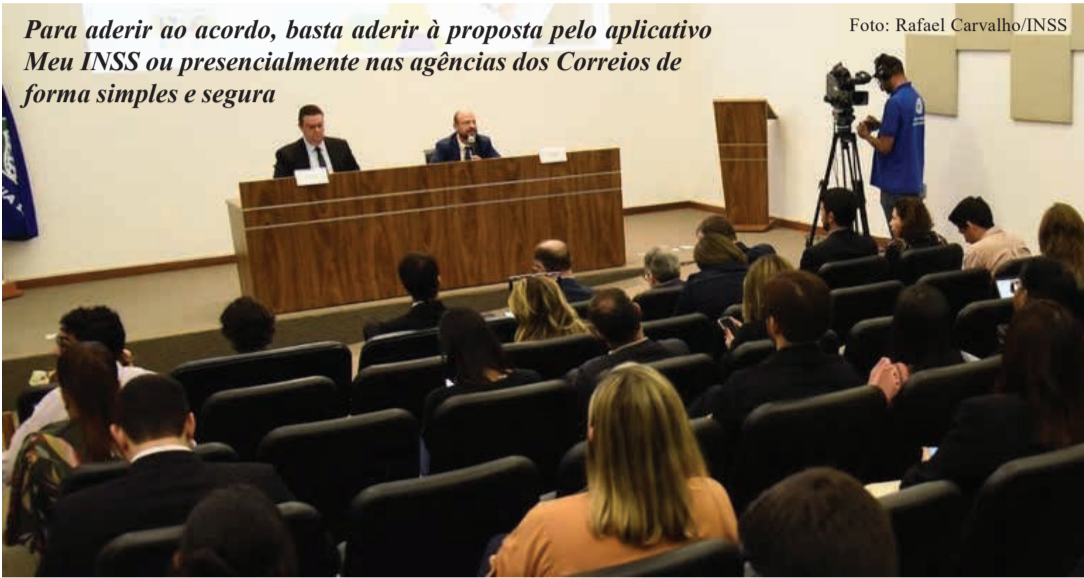
Para aderir ao acordo, basta aderir à proposta pelo aplicativo Meu INSS ou presencialmente nas agências dos Correios de forma simples e segura

“Quem pode aderir ao acordo? Aposentados e pensionistas que contestaram o desconto indevido, aguardaram 15 dias úteis e não obtiveram resposta da entidade envolvida”, explicou Waller. Ele destacou que mais de 1,8 milhão de pessoas já estão aptas a aderir. O plano de ressarcimento é resultado de um acordo de conciliação homologado pelo Supremo Tribunal Federal (STF) e assinado por diversas instituições, entre elas o Ministério da Previdência Social, o INSS, a Advocacia-Geral da União (AGU), a Defensoria Pública da União (DPU), o Ministério Público Federal