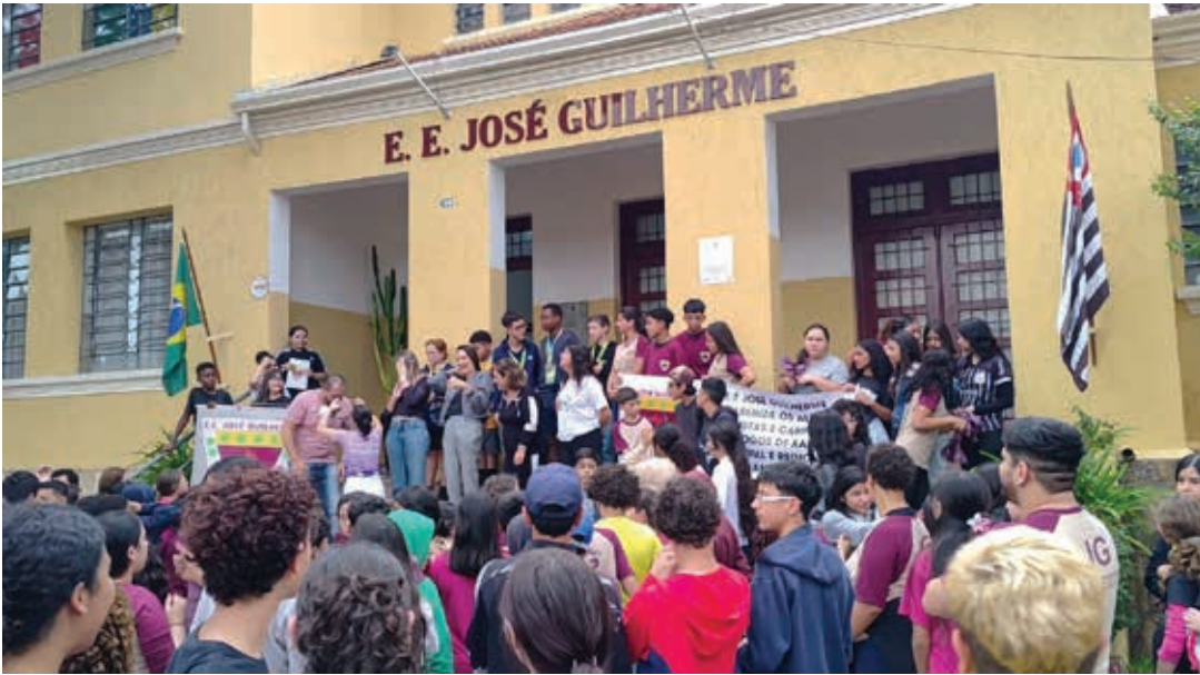
Ao chegarem à Escola José Guilherme, os alunos campeões foram homenageados

xadrez promove paciência, perseverança, tomada de decisões sob pressão e o desenvolvimento da autoestima. Esses valores se refletem na vida pessoal e profissional dos estudantes e dialogam diretamente com a proposta pedagógica de nossa escola”, destacou.