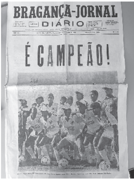
A edição especial pela conquista circulou na segunda-feira, 27 de agosto de 1990