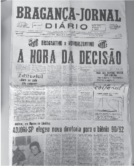
Na época, o BJD, principal jornal de Bragança, estampou em sua capa duas manchetes no sábado, 25 de agosto de 1990