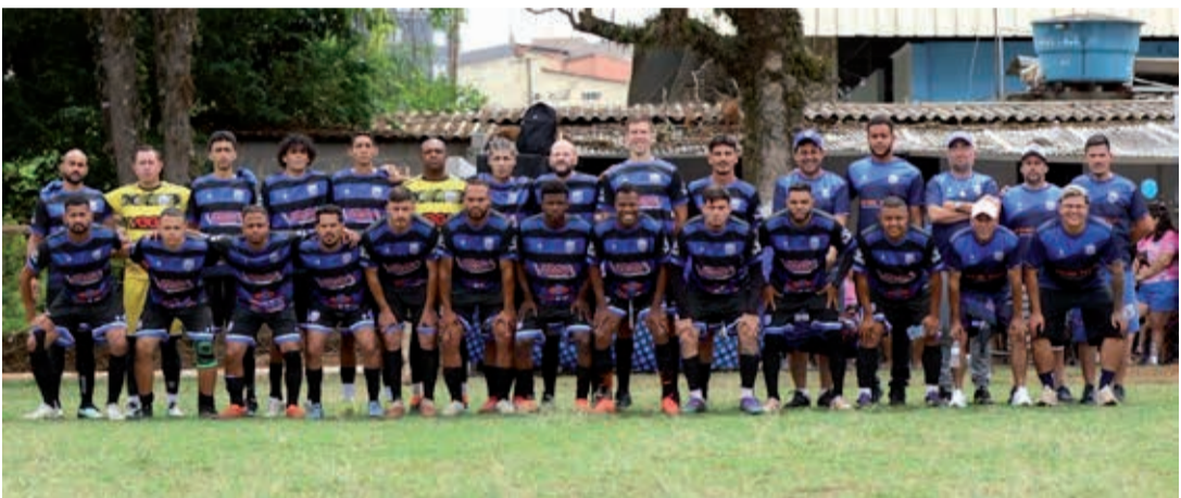
Equipe do Sparta Villa, vice-campeã, fez uma campanha brilhante, perdendo apenas um jogo durante todo o campeonato

Com o título, o Rio Acima garantiu o acesso à Série B do Campeonato Amador de 2026, seguindo o caminho de sucesso de outras equipes da vizinha cidade de Vargem, que vem se destacando nas competições organizadas pela Liga Bragantina de Futebol (LBF). Neste ano, o Bandeirantes de Vargem conquistou o título da Série B e se juntou à equipe da AD Vargense na elite do futebol amador de Bragança Paulista.