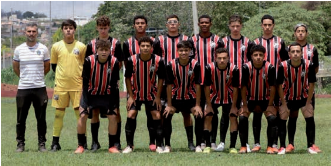
Time Sub-17 do São Lourenço A disputa a semifinal da Série Ouro

O Campeonato Municipal de Menores – temporada 2025, organizado pela Liga Bragantina de Futebol, entra na reta decisiva com a realização das semifinais das Séries Ouro e Prata nas categorias Sub-15 e Sub-17. Os jogos prometem muita emoção neste fim de semana, em