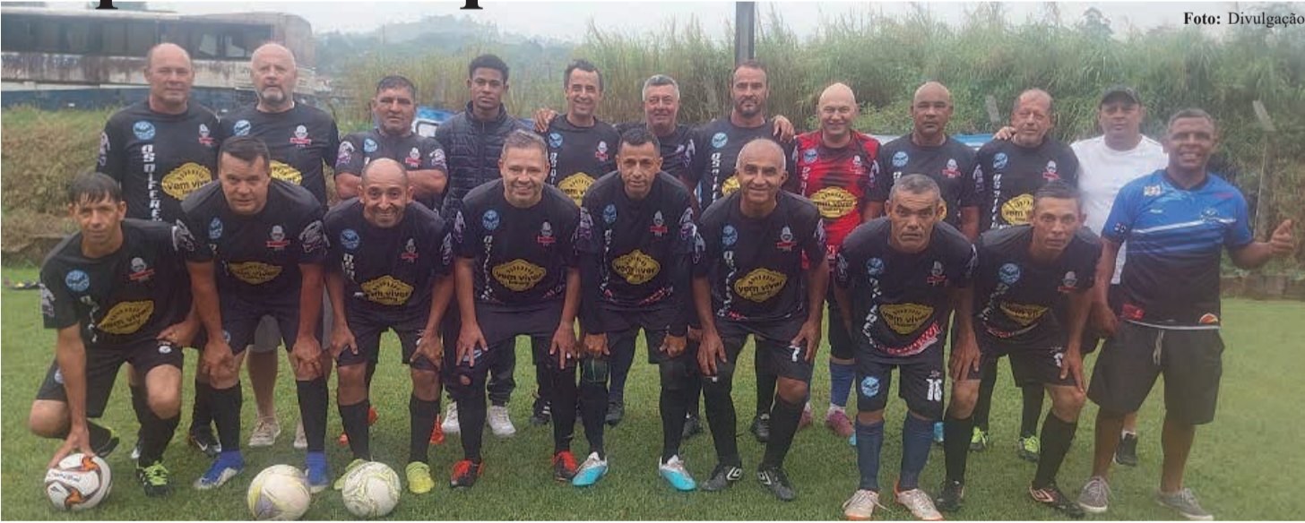
Time Os Diferentes estreou com derrota por 1 a 0 para o Santa Luzia

O Campeonato de Veteranos – categoria 50 Anos – continua neste sábado, 25, com a disputa da segunda rodada. As partidas acontecem nos campos do Jardim da Fraternidade, do Atibaianos e no Estádio Lincoln Rodrigues Siqueira, na Santa Luzia.