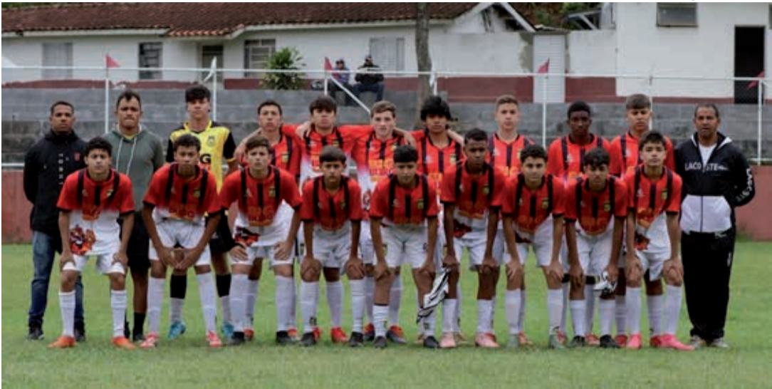
Categoria Sub-15 do Bucks Park joga a semifinal da Série Prata

ta a campo pelo Sub-17 da Série Ouro, enfrentando o São Lourenço B. Encerrando a manhã, às 10h30, duelam Legionários e São Lourenço A, também pela Série Ouro do Sub-17.