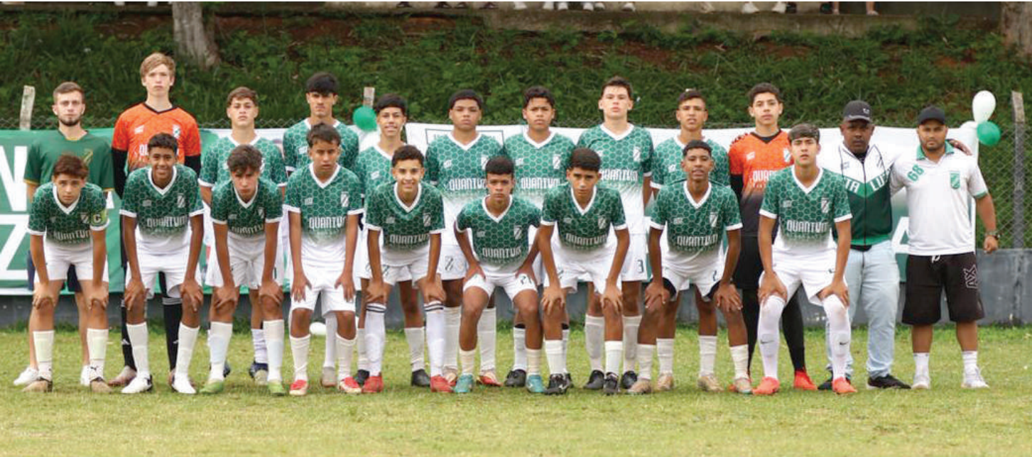
Time do Santa Luzia, campeão da categoria Sub-15