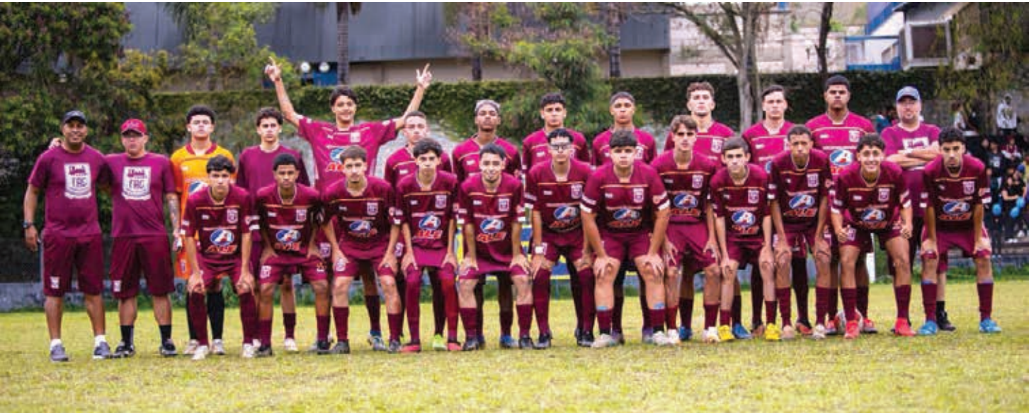
Na categoria Sub-17, o Ferroviários conquistou o título