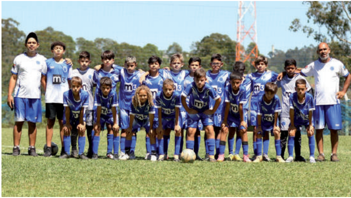
Equipe do Cruzeiro foi a campeã da categoria Sub-11