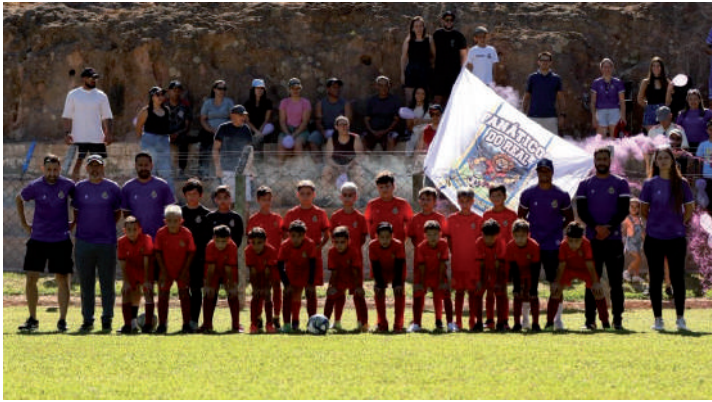
Time Sub-9 do Real Bragança ficou com o título