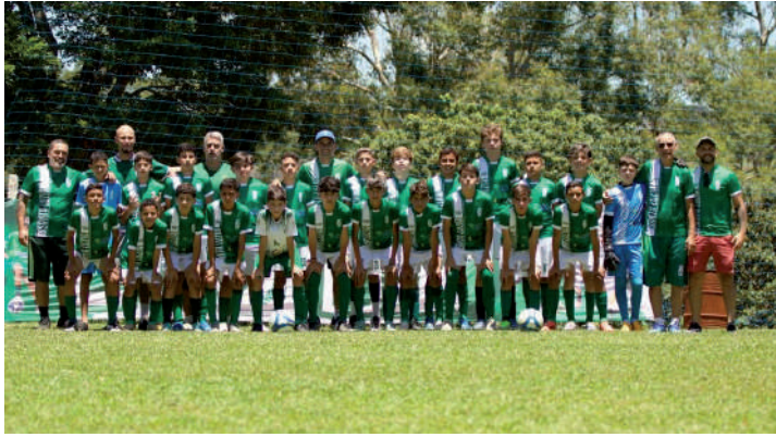
Na categoria Sub-13, o Santa Luzia também ficou com o vice-vicecampeonato

A edição 2025 da Real Cup, uma das principais competições de categorias de base de Bragança Paulista, foi encerrada no último domingo, 30, com casa cheia no Estádio Lincoln Rodrigues Siqueira, campo do Santa Luzia. O público acompanhou de perto três finais emocionantes envolvendo clubes amadores da cidade e da região, nas categorias Sub-9, Sub-11 e Sub-13.