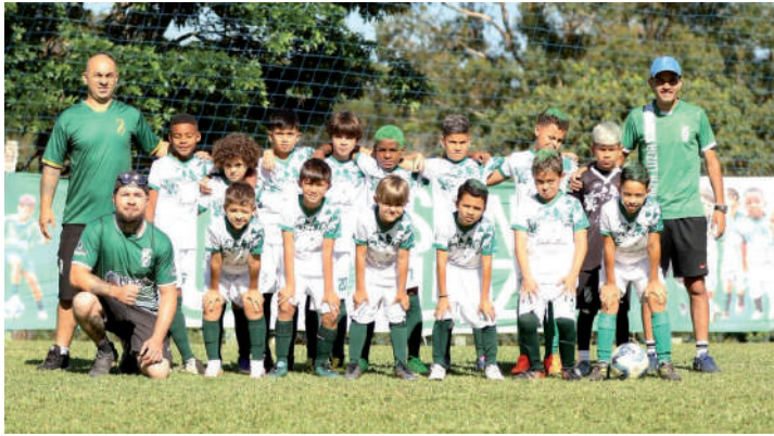
O Santa Luzia foi vice-campeão na categoria Sub-9