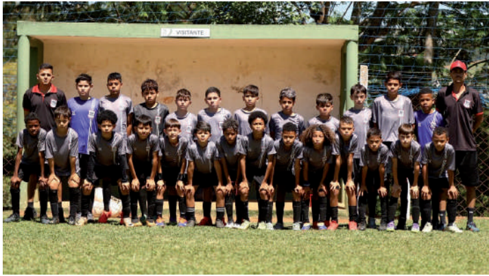
O DS Sports terminou com o vice-vicecampeonato na categoria Sub-11