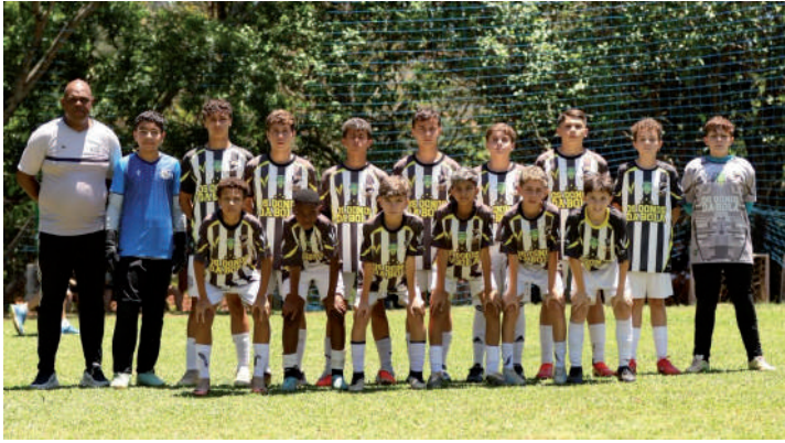
Os Meninos da Vila levaram o troféu de campeões da categoria Sub-13