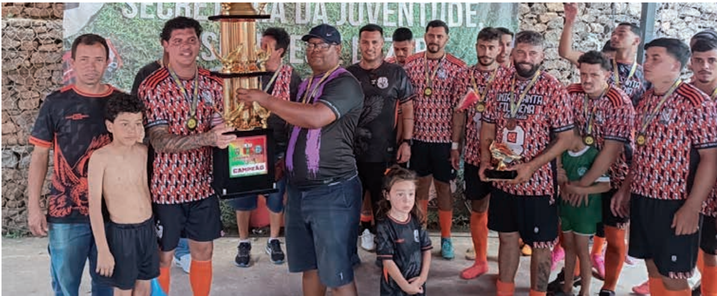
União Santa Filomena - campeão

A manhã da última domingo, 7 de dezembro, foi de festa no Estádio Olímpio Rodrigues, o campo do Ferroviários, que recebeu um excelente público para acompanhar a final da Série D do Campeonato Amador de Bragança Paulista. Em campo, União Santa Filomena e Central Paulista protagonizaram uma decisão movimentada e digna da temporada.