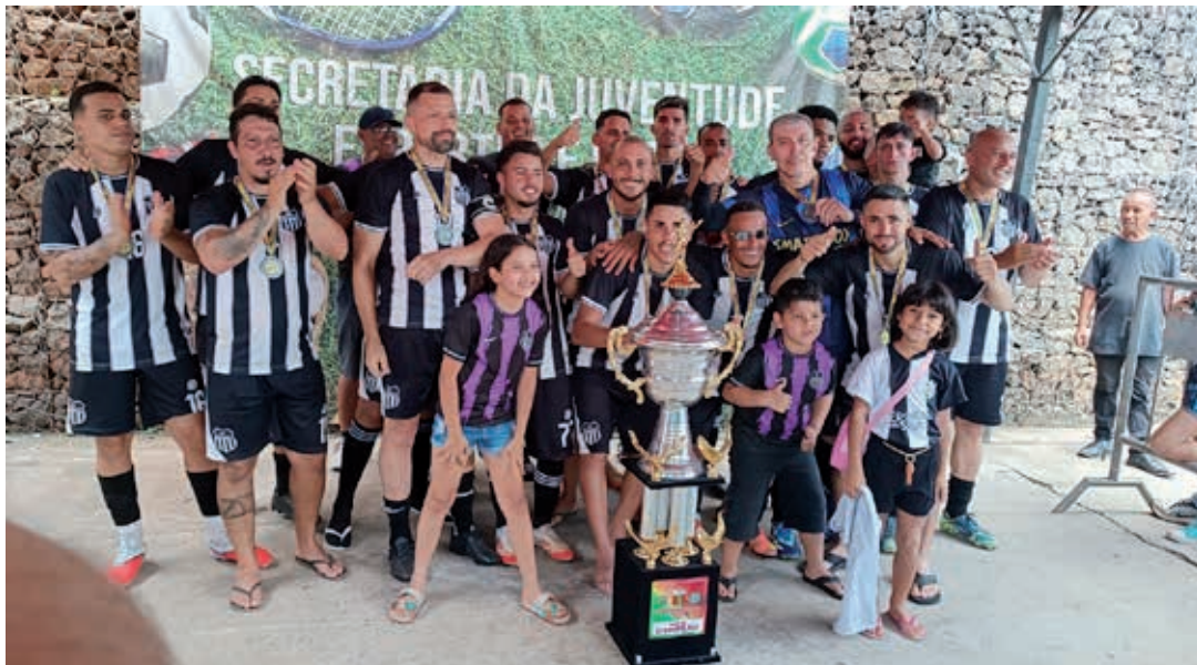
Central Paulista - vice-campeão