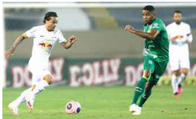
Lance da partida entre Red Bull Bragantino x Guarani, que decidiu o título do Troféu do Interior em 2020.

Na ocasião o Massa Bruta do atacante Artur conquistou o título.