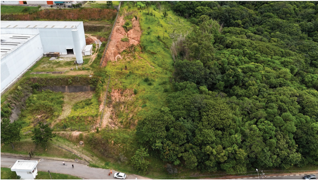
Terreno Volk Confeções