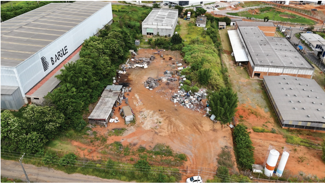
Terreno Tropical Estufas