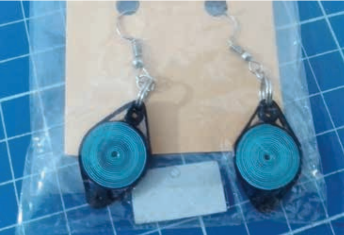
Brincos em Quilling