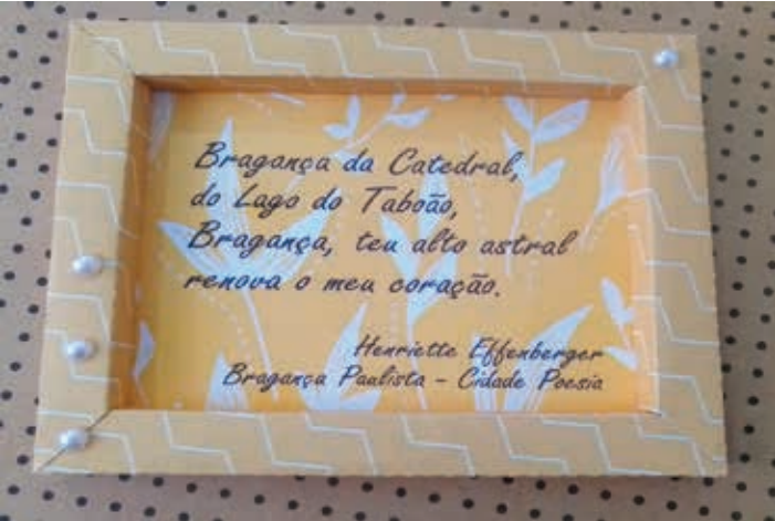
Quadrinhos em papel de scrapbook com versos de poetas bragantinos. Valor: R$ 15,00 cada