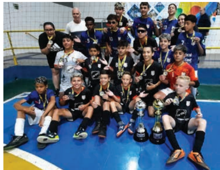
As equipes Atibaia Futsal B (campeão) e Atibaia Futsal A (vice-campeão) da categoria Sub-14