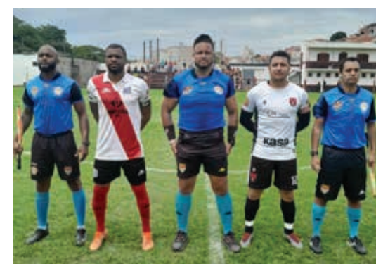
A arbitragem na partida final contou com: Bel (árbitro), Sidnei (auxiliar 1) e Adelino (auxiliar 2)