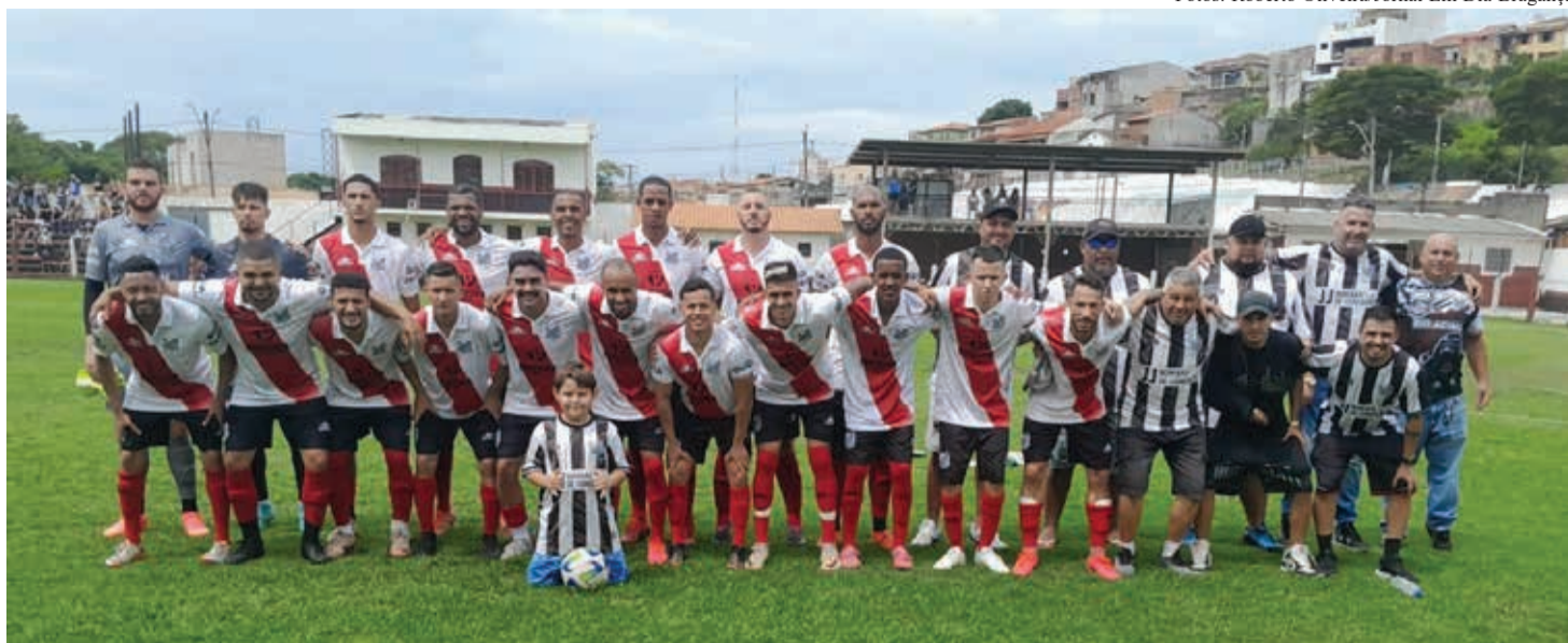
TIME DO RIO ACIMA, CAMPEÃO INVICTO DO AMADOR DA SÉRIE D DE 2024