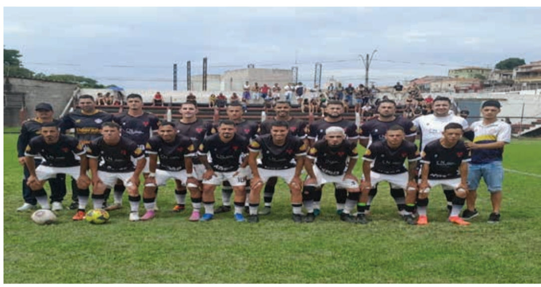
Time do Moleque Travesso, vice-campeão