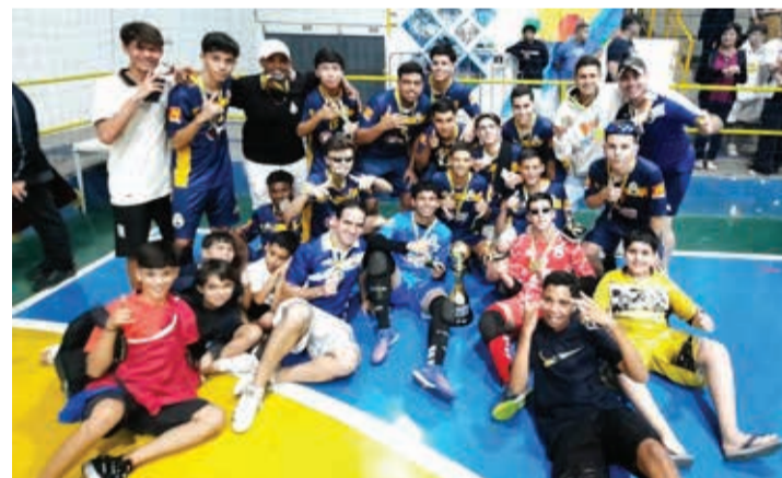
Time do Real Madruga, campeão da categoria Sub-16