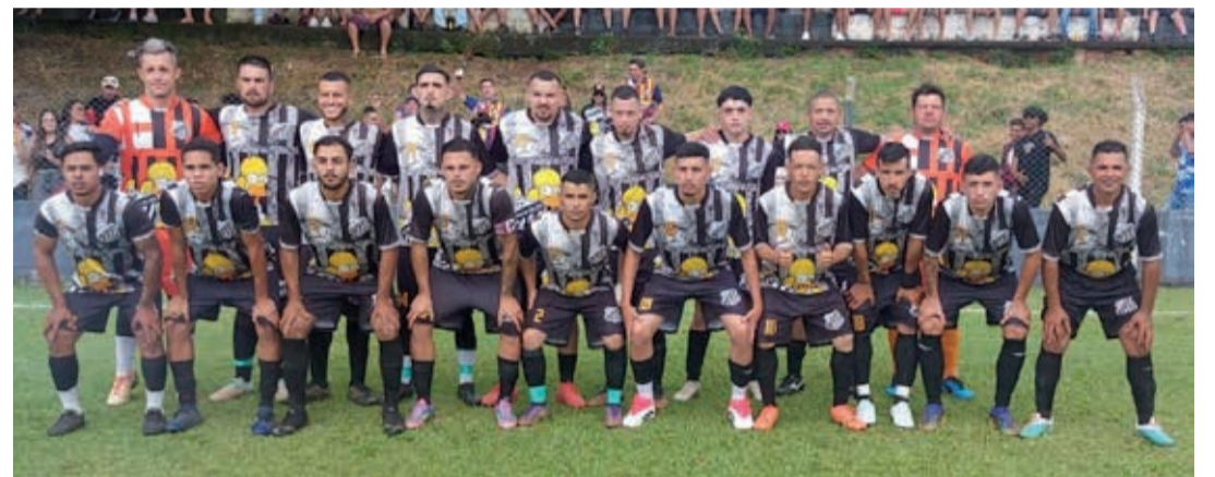
Equipe do Biriçá do Valado ficou com o vice-campeonato