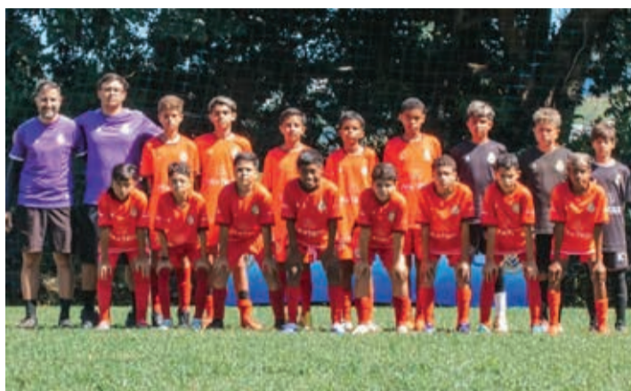
Real Bragança campeão da categoria Sub-13