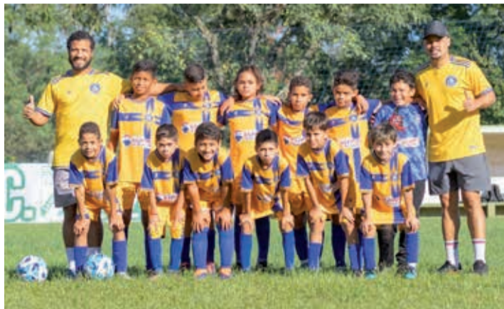
Legionário campeão da categoria Sub-10