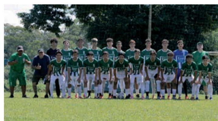
Santa Luzia campeão da categoria Sub-17

No Sub-13, o equilíbrio prevaleceu durante o tempo regulamentar, com empate sem gols. A definição veio nas penalidades, onde o Real Bragança levou a melhor e venceu por 5 a 4, ficando com o título. Já na categoria Sub-15, a equipe repetiu o bom desempenho e, com gol de Guga, derrotou o Santa Luzia por 1 a 0, garantindo