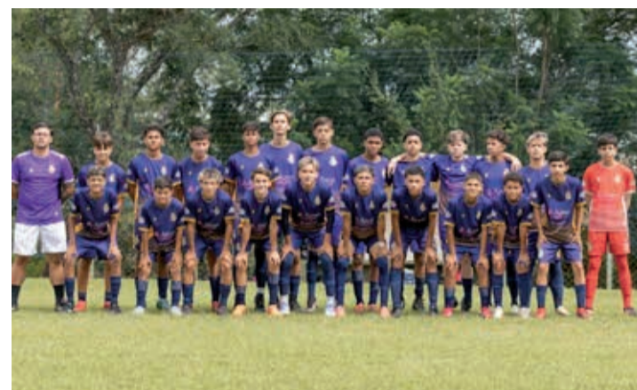
Real Bragança campeão da categoria Sub-15