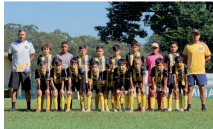
Legionário campeão da categoria Sub-11