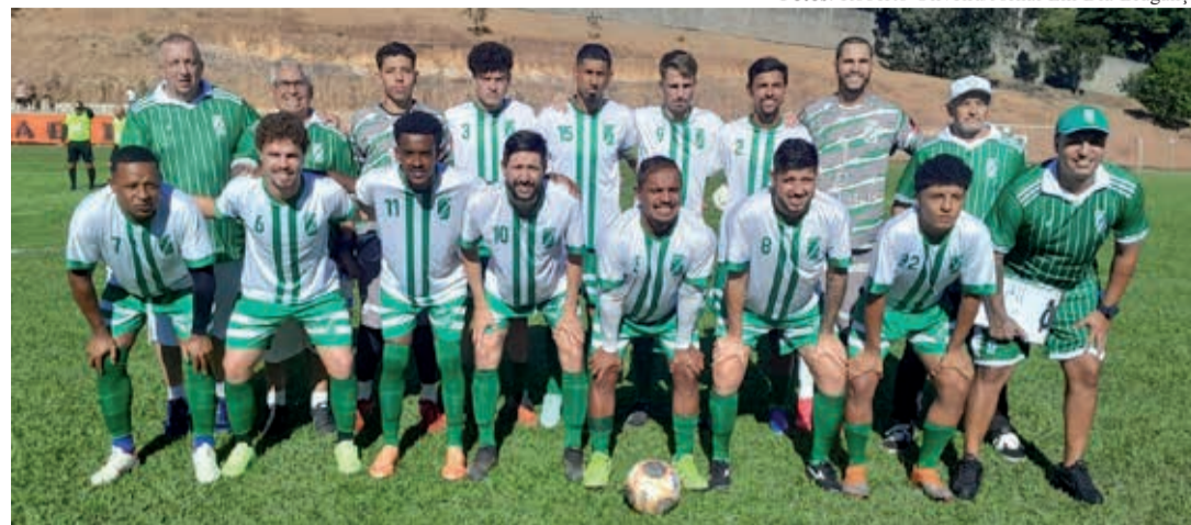
Equipe do Santa Luzia vai até a cidade de Tuiuti em busca da primeira vitória no campeonato

Pelo Grupo A, a rodada também reserva duelos importantes. No Estádio Zezinho Sampaio (Uberaba), o Cedega enfrenta o Bandei-