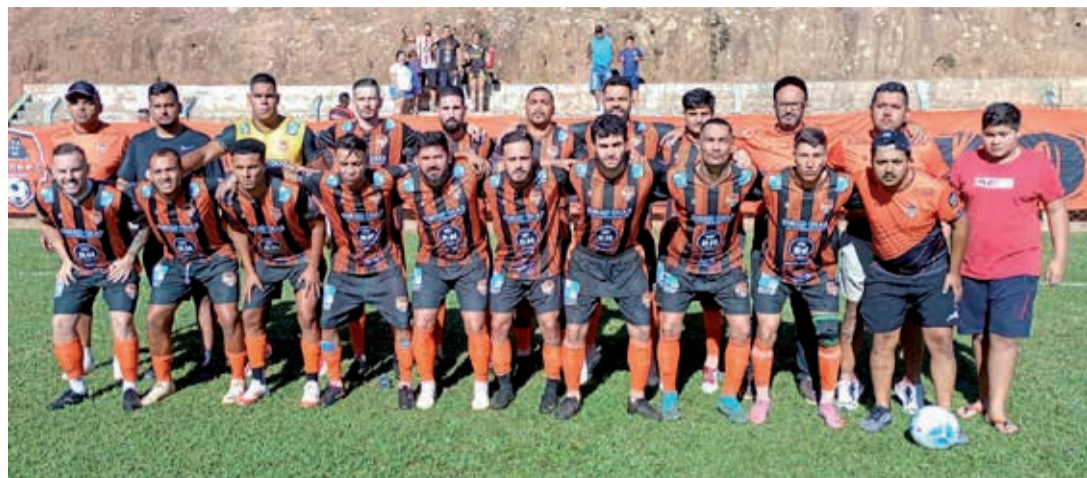
Time do Cedega joga como mandante neste sábado, no campo do Unidos, contra o Bandeirantes

A segunda rodada do Campeonato Amador da Primeira Divisão de Bragança Paulista – edição 2026 – será disputada na tarde deste sábado, 18 de abril, com todos os jogos marcados para as 15h15, respeitando os 15 minutos de tolerância previstos no regulamento.