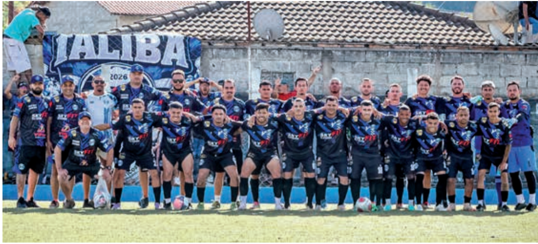
Fora de casa, o São Miguel terá uma parada difícil diante do líder invicto Bandeirantes

A 4ª rodada do Campeonato Amador da Primeira Divisão de Bragança Paulista 2026 promete fortes emoções na tarde deste sábado, 2 de maio. Todas as partidas estão marcadas para as 15h15, com os tradicionais 15 minutos de tolerância.