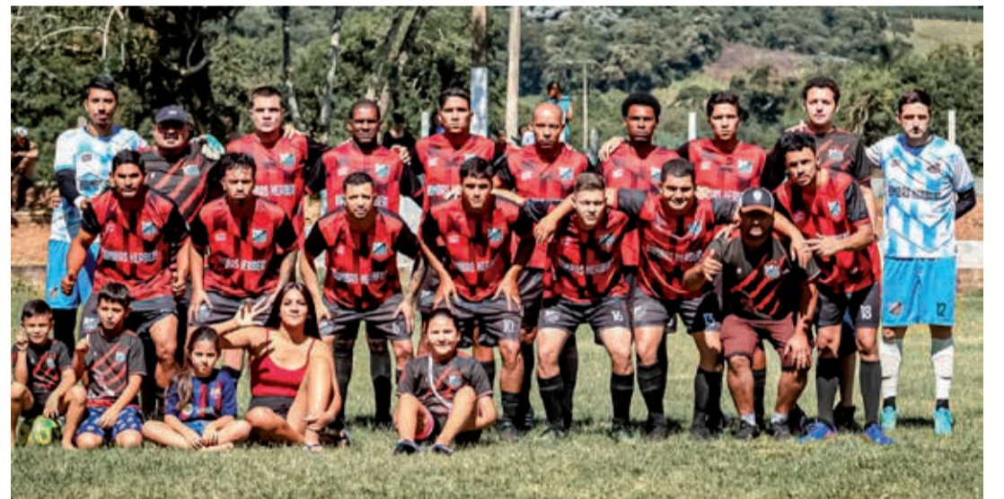
Time do Rio Acima

Os jogos serão realizados no campo do Bacci, e a expectativa é de um bom público presente para acompanhar a final. Após as partidas, haverá cerimônia de premiação com entrega de troféus para os três primeiros colocados, além de prêmios individuais para o artilheiro e a defesa menos vazada.