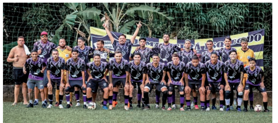
Equipe do São Marcos