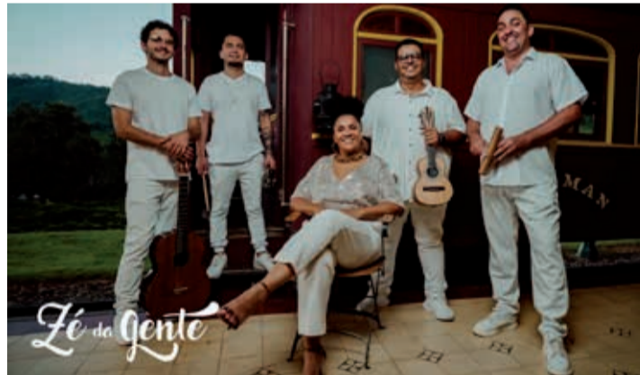
Amanhã, às 19h, o público tem encontro marcado com muito samba e alegria no Teatro Carlos Gomes, no Centro Cultural Prefeito Jesus Adib Chedid, com o show do Grupo de Samba Zé da Gente

A edição de Bragança Paulista integra o circuito nacional do projeto em 2026, que percorre diversas cidades brasileiras, conectando o país à mobilização global do Dia Internacional do Jazz. O Mú-