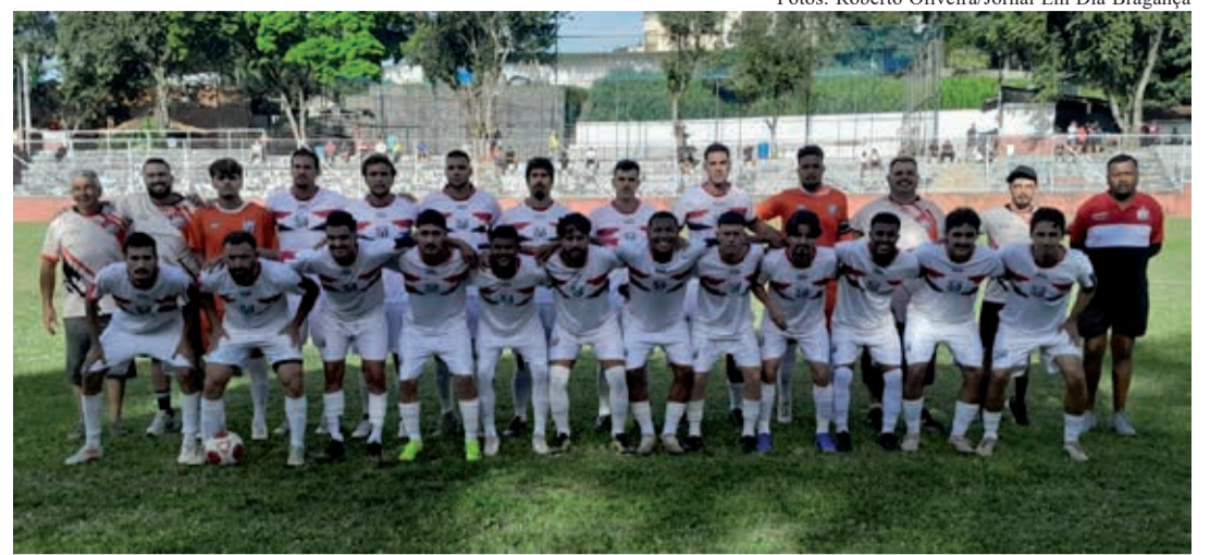
Equipe do São Lourenço, vice-líder do Grupo B, folga na rodada deste sábado

Já a partida entre São Lourenço e Hípica Jaguari não será realizada após a