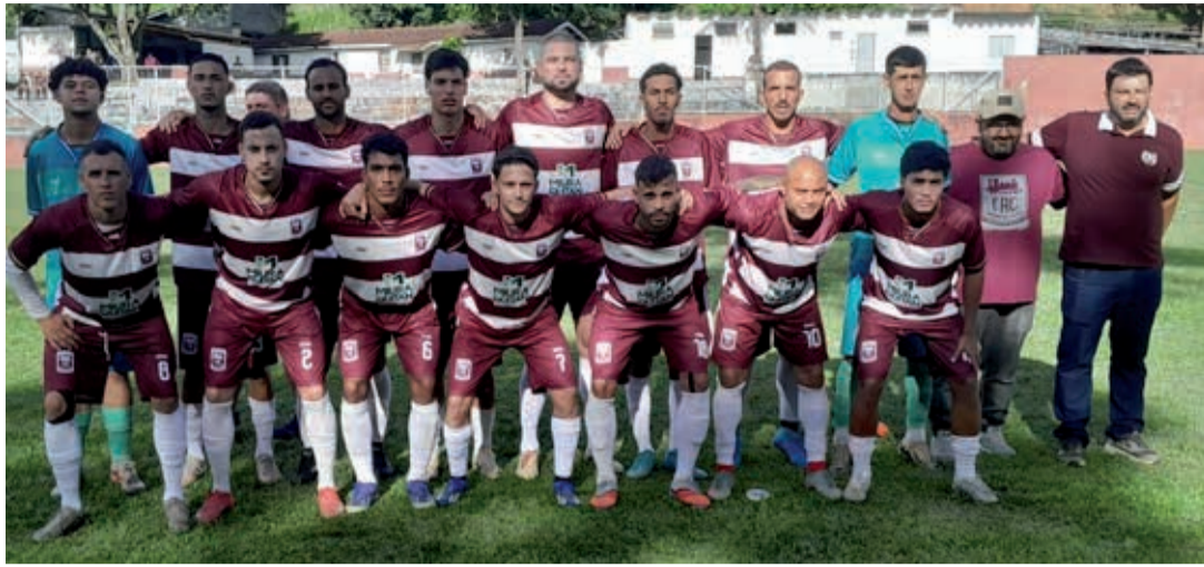
Time do Ferroviários, líder isolado do Grupo B, já está classificado para a fase mata-mata

Com duas equipes já classificadas matematicamente para as quartas de final – o Ferroviários e o Bandeirantes – a rodada deste sábado, 16, do Campeonato Amador da Série A de Bragança promete fortes emoções. As partidas começam às 15h15, com os demais times buscando vitória e a classificação para a próxima fase do Amadorzão 2026.