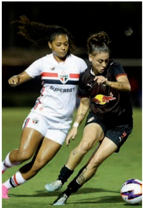
Pelo Paulistão Feminino, as bragantinas derrotaram o São Paulo fora de casa na última quinta-feira

O time feminino do Red Bull Bragantino Feminino volta a campo neste domingo, 23 de maio, para mais um compromisso importante e difícil pelo Campeonato Brasileiro 2026. As Bragantinas enfrentam o Palmeiras, às 15h, no Estádio Municipal Cícero de Souza Marques, em Bragança Paulista, pela 12ª rodada da competição nacional.