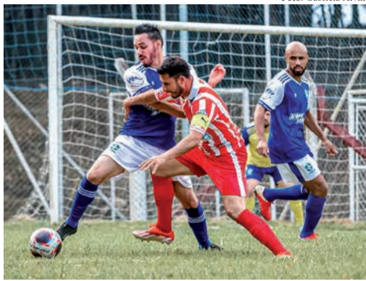
A equipe da Vargense garantiu classificação antecipada após vencer o Internacional por 4 a 0, fora de casa

A fase classificatória do Amadorzão da Série A de Bragança Paulista – temporada 2026 – chega ao fim na tarde deste sábado, 23, com a realização da última rodada da primeira fase. Os confrontos prometem fortes emoções, já que ainda restam vagas em aberto para as quartas de final da competição organizada pela Liga Bragantina de Futebol (LBF).