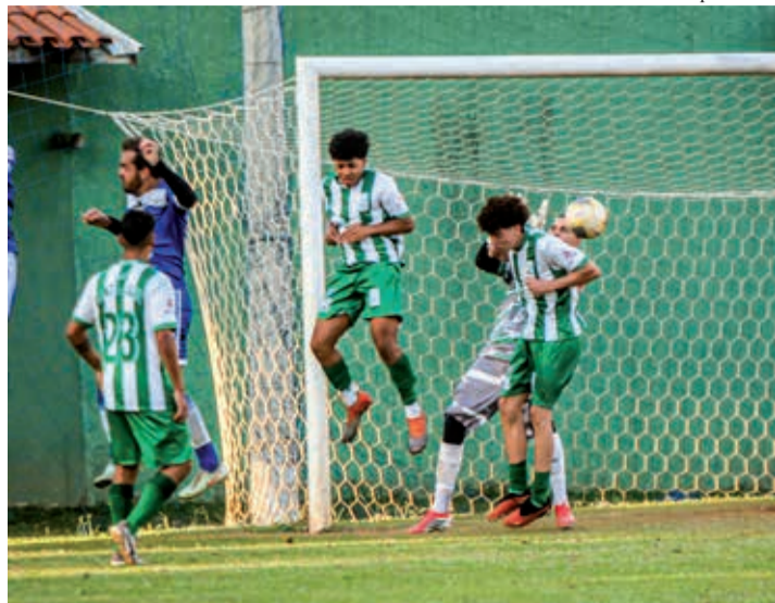
Lance da partida em que o Santa Luzia fez o dever de casa e derrotou o Campo Novo Paulista por 1 a 0