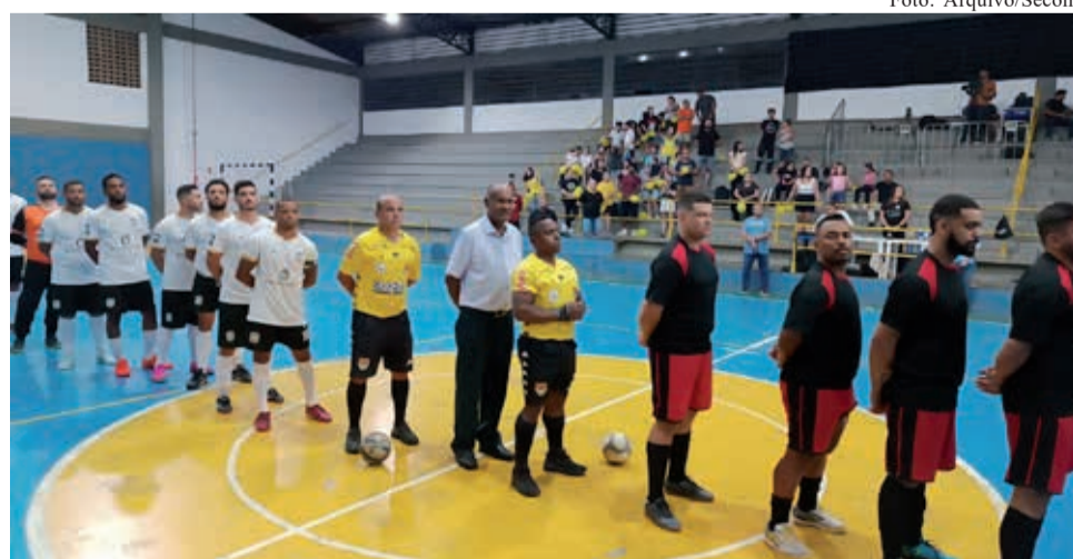
Em 2025, as igrejas Jesus Copy e Escudo da Fé decidiram o título da Copa Evangélica de Futsal

A competição é organizada pela Secretaria Municipal da Juventude, Esporte e Lazer (Semjel), em parceria com a Liga Bragantina de Futebol (LBF), reforçando o incentivo à prática esportiva e ao fortalecimento da união entre as comunidades. As equipes interessadas poderão realizar a inscrição até o dia 12 de junho. Já o congresso técnico da competição acontecerá no dia 15 do mesmo mês, quando serão apresentados o regulamento oficial, o formato do campeonato e demais orientações para os representantes das equipes.