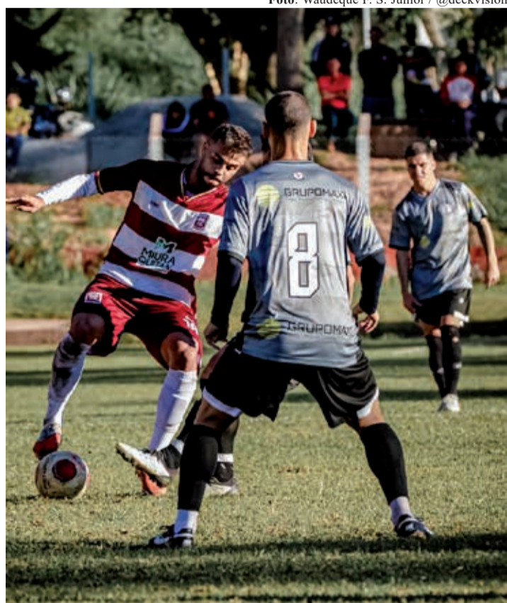
O Ferrovários garantiu sua vaga na final ao vencer o Vila Aparecida por 3 a 0 no tempo normal, em duelo válido pela semifinal