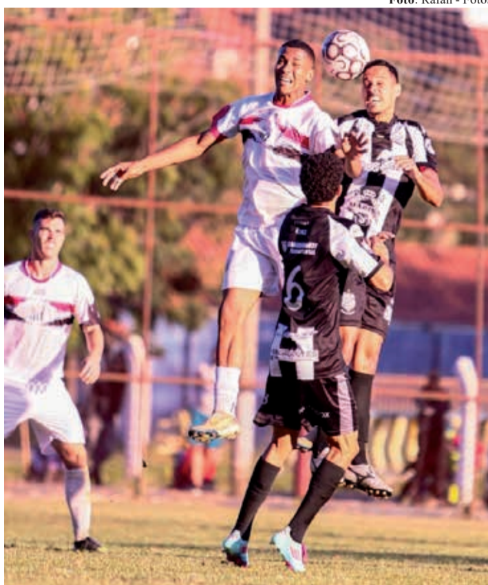
Na outra semifinal, o Campinho levou a melhor sobre o São Lourenço nas cobranças de pênaltis e também avançou à grande decisão