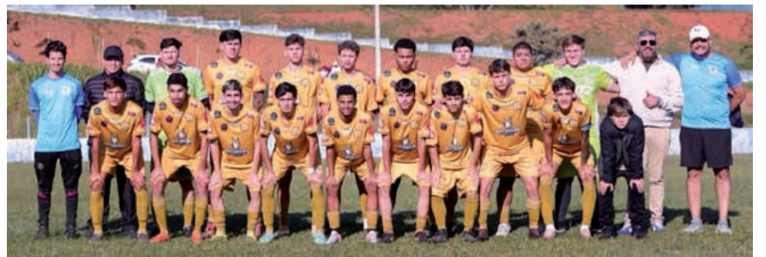
Vila Aparecida, campeã da Série Prata

O Campeonato Amador Sub-20 de 2026, promovido pela Liga Bragantina de Futebol em parceria com a Secretaria Municipal da Juventude, Esportes e Lazer (Semjel), chegou ao fim no último domingo, 7, com as decisões das Séries Ouro e Prata realizadas no Estádio Municipal José Francisco Sampaio, campo do Unidos, no Bairro Uberaba.