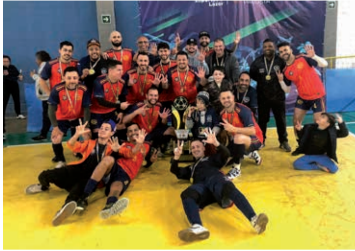
Equipe da Santher A, campeã da Série Ouro