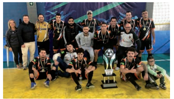
Equipe da TE Connectivity, vice-campeã da Série Prata