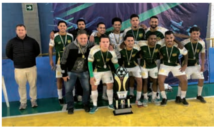
BBM Madeiras, vice-campeã da Série Ouro

aplicação de 169 cartões amarelos e 27 cartões vermelhos durante todo o campeonato.