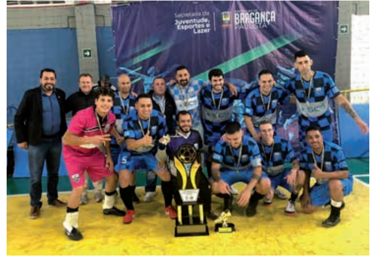
Santa Casa Saúde, campeã da Série Prata